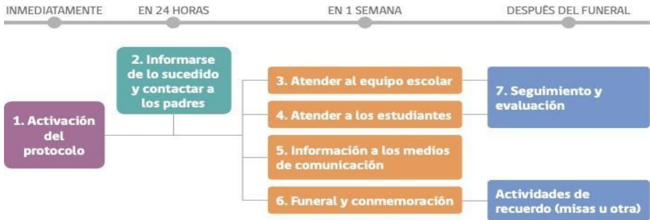
Diagrama de actuación de conformidad a recomendaciones del MINSAL.