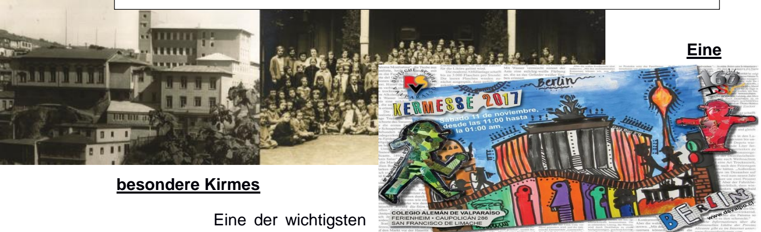
Die Deutsche Schule von Valparaíso auf dem Cerro Concepción (1870)

Die Deutsche Schule wurde 1857 in Valparaíso als erste Institution gegründet, die eine direkte Folge der Einwandererzahlen war. Das Schulgebäude, das heute ein historisches Baudenkmal ist, wurde auf dem Cerro Concepción errichtet. Mit der Eröffnung des neuen Schulgebäudes auf dem Cerro Concepción am 23. Januar 1870 begann ein neues Kapitel ihrer Geschichte. Dann zerstörte das Erdbeben vom 16. August 1906 das neue Schulgebäude, das auf dem Cerro Concepción stand und nach dem Erdbeben von 1985 begannen die Bauarbeiten für das neue Schulgebäude in El Salto, Viña del Mar. Im Jahr 1988 siedelten die Schüler aus Viña del Mar und Valparaíso dorthin um. Heute ist die Deutsche Schule, die jetzt 1.300 Schüler hat, eine der wichtigsten