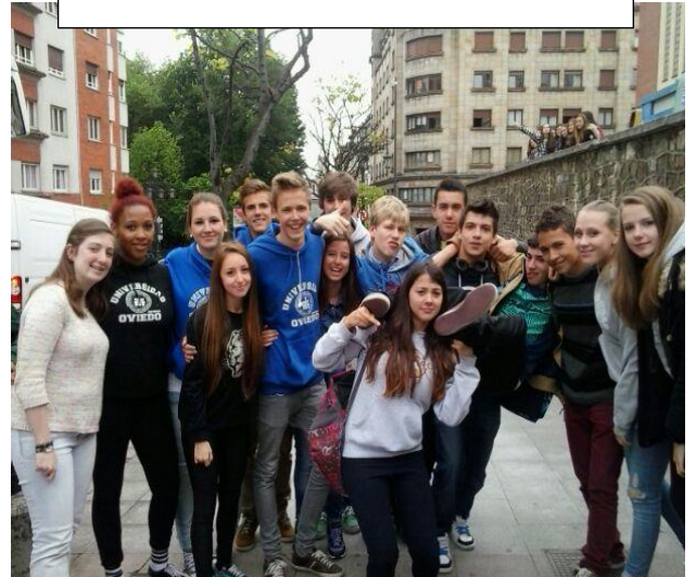
Deutschen Schüler mit Schüler von anderen Länder