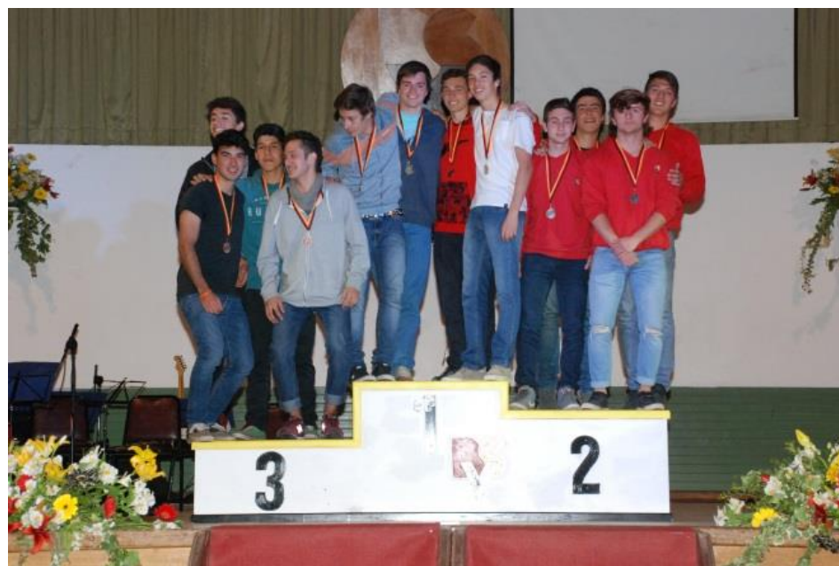
2º Lugar Relevó 4 x 100 Cat. Intermedia