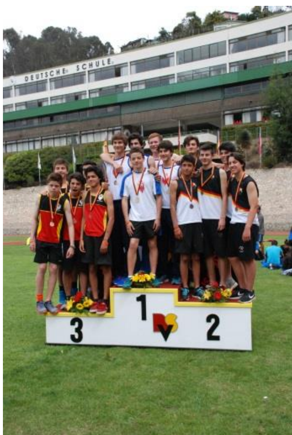
3º lugar Relevó 5x 80 Cat. Infantil