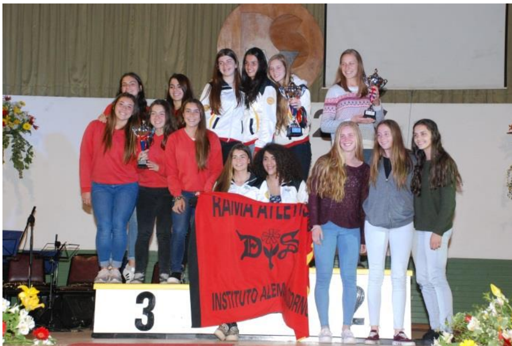
3º Lugar Categoría Superior Damas