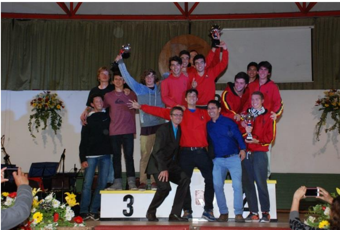
1º Lugar Categoría Superior Varones