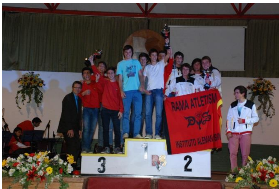
3º Lugar Categoría Intermedia Varones