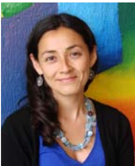
Mª Paz Unzueta Kindergarten