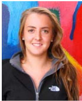
Valentina Olfos Kindergarten