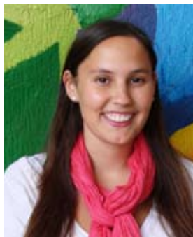
Camila Weber Kindergarten