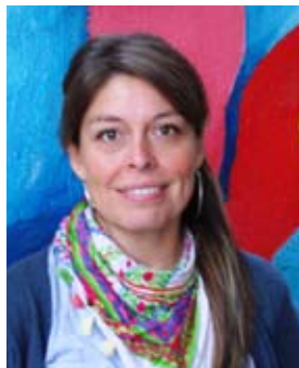
Carolina Mercado Artes Visuales